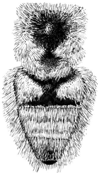
图 311 红盾毛管蚜蝇 Mallota rossica Portschinsky ♂ 腹部 (背面观) (abdomen in dorsal view)